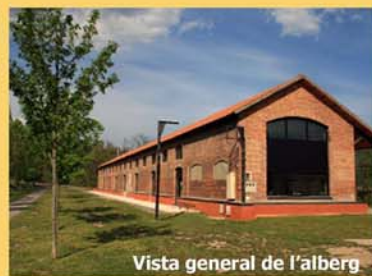
Vista general de l'alberg

L'alberg rural Ruta del Ferro té una situació privilegiada: al peu dels Prepirineus , a Sant Joan de les Abadesses. Disposa d'unes instal·lacions de qualitat per acollir grups o famílies en una estada confortable.