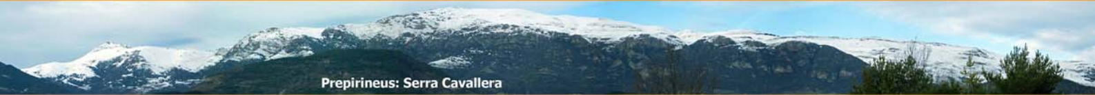
Prepirineus: Serra Cavallera